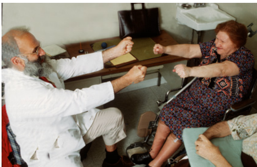
Oliver Sacks con una paciente en el Hospital Beth Abraham de Nueva York.