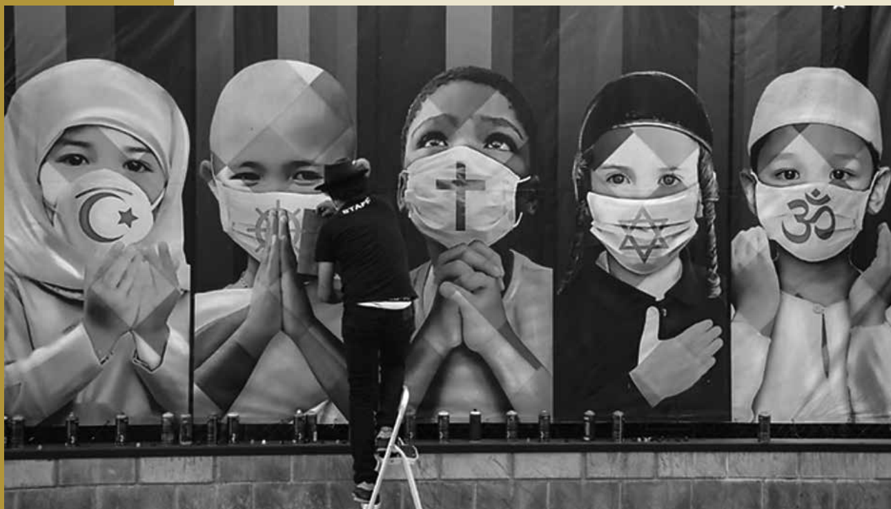
Kobra, un muralista brasileño confinado promueve la unidad en pandemia.