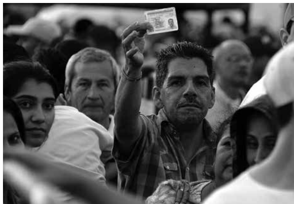
VOZ DE AMÉRICA

La política y el ejercicio del poder, como toda actividad humana, forman parte y son objeto de esa lucha espiritual entre logoi y logismoí , y ese era precisamente el dilema de nuestro joven político.