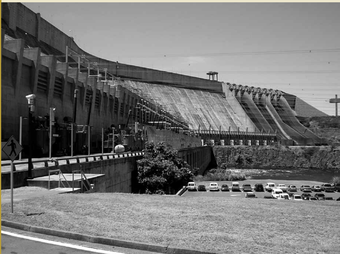
CENTRAL HIDROELÉCTRICA SIMÓN BOLÍVAR

El proceso de desplazamiento del personal capacitado de las empresas operadoras se inició tempranamente y continúa hasta nuestros días. En efecto, durante los primeros años del gobierno de Chávez, la mayoría del personal