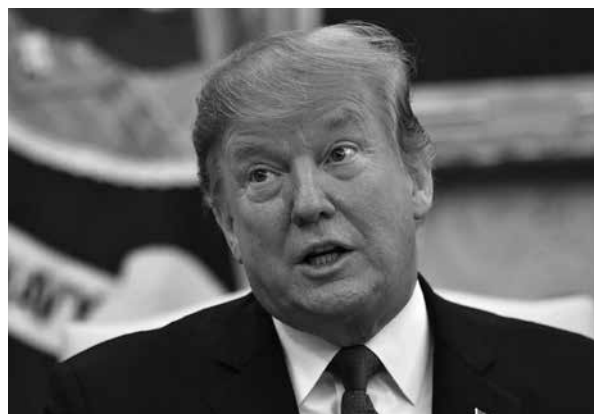
Donald Trump, presidente de EE.UU., 2019.