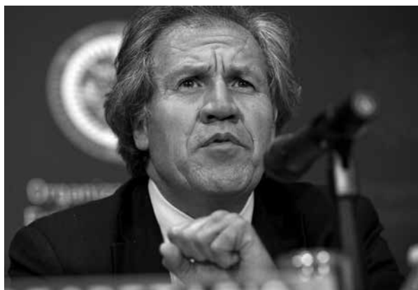
Luis Almagro, Secretario General de la OEA.