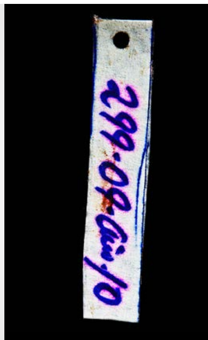
Galería de Papel. Expedientes, fragmentos de un país. Juan Toro Díez (2015).

nes discursivas, retratos de nuestras realidades residuales, registros que dejan constancia física, mensurable, de aquello que nos constituye como drama contemporáneo: el desarraigo, la inviabilidad ciudadana, la inestabilidad emocional, la intolerancia, la violencia política, la violencia social, la violencia a secas, el exilio, la fobia al lugar, la fobia al país, la fobia al paisaje, la fobia al otro que nos complementa. Hablamos de los vestigios de una arqueología reciente e inmediata, una arqueología próxima de los mundos cotidianos, una arqueología que transita lo público y lo privado. Una arqueología de un país ruin, arruinado y en ruinas. Las tres RRR del fracaso perfecto.