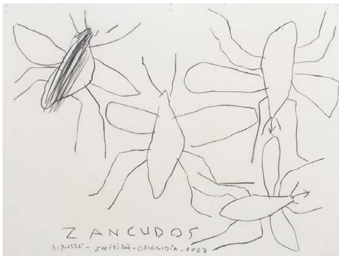
Galería de Papel. (In) Visibilis. Octavio Russo (2024).