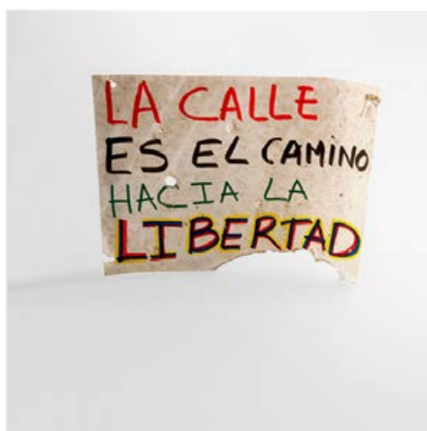
Galería de Papel. Expedientes, fragmentos de un país. Juan Toro Díez (2015).