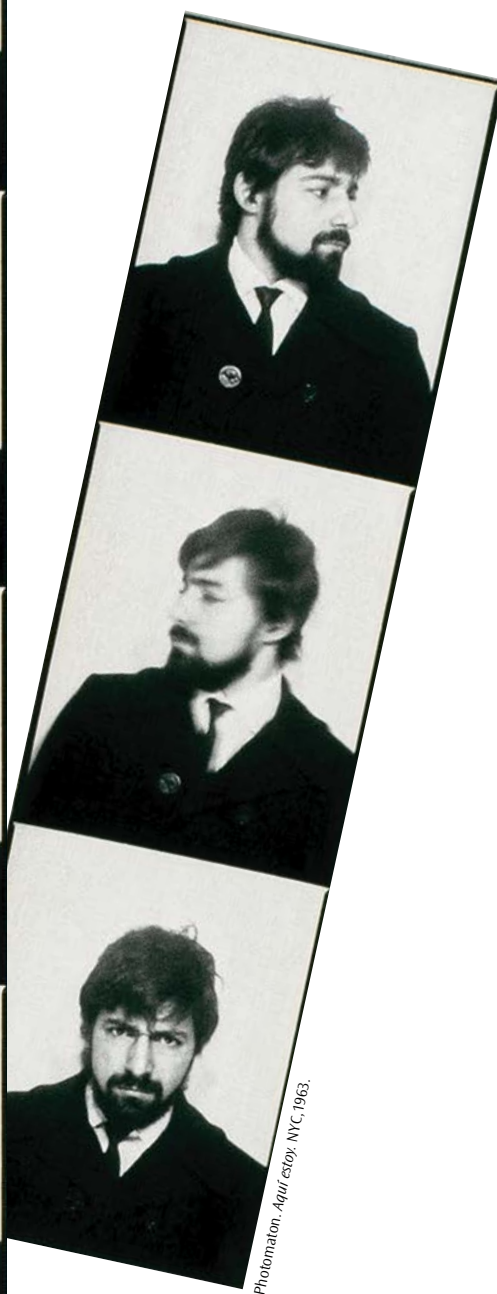
Photomaton. Aquí estoy. NYC, 1963.