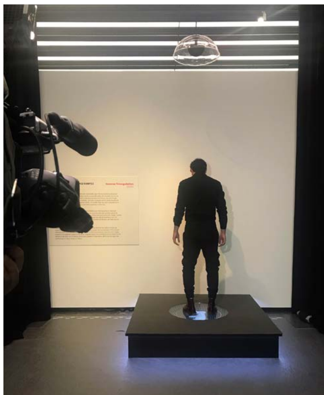
Galería de Papel. Inverse Triangulation . Meeting Point -16-21. Solimán López (2023).